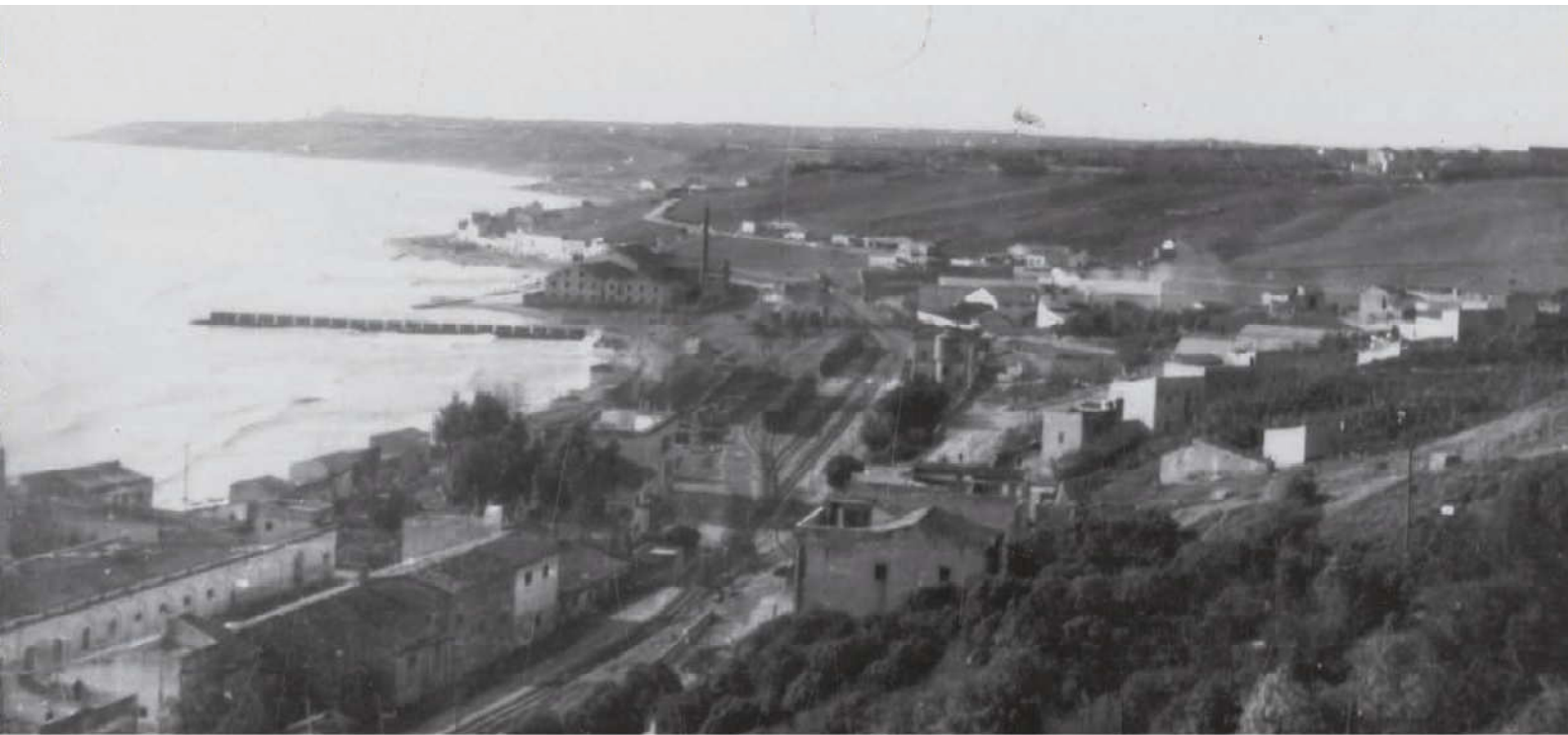
Veduta della città di Biserta durante la Seconda guerra mondiale.