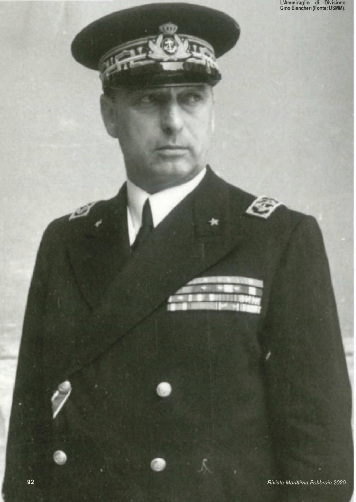
L'Ammiraglio di Divisione Gino Biancheri.