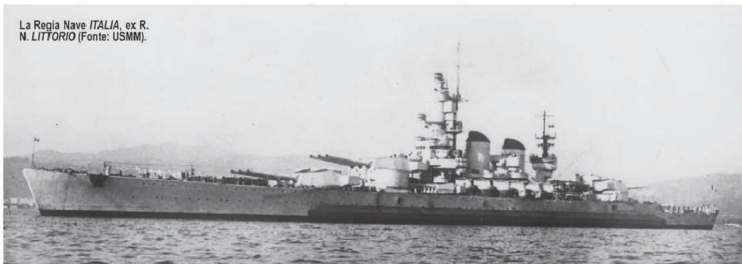
La Regia Nave ITALIA, ex R. N. LITTORIO (Fonte: USMM).

La decisione di trasferire le navi in un porto Alleato non fu dunque presa a cuor leggero da Biancheri, che d'improvviso si trovò nelle stesse condizioni in cui, un quarto di secolo prima, si erano venuti a ritrovare gli ammiragli del Kaiser, ai quali era stato trasmesso l'ordine di trasferire la flotta imperiale nella base della Royal Navy delle isole Orcadi (Scapa Flow), per ottemperare agli accordi sottoscritti nella foresta di Compiègne l'11 novem-