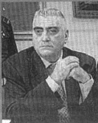
Il procuratore Agostino Cordova