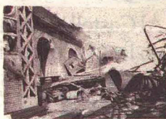
Il cantiere navale distrutto