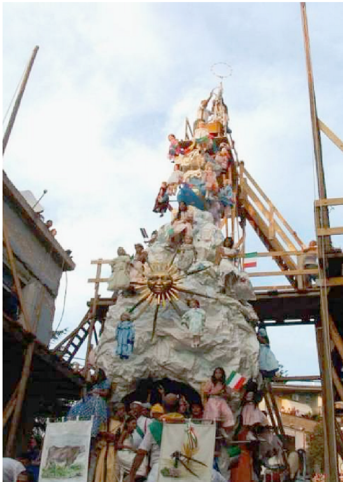
Nelle immagini alcuni obelischi denominati “Gigli” e che a Nola vengono eretti in onore di San Paolino