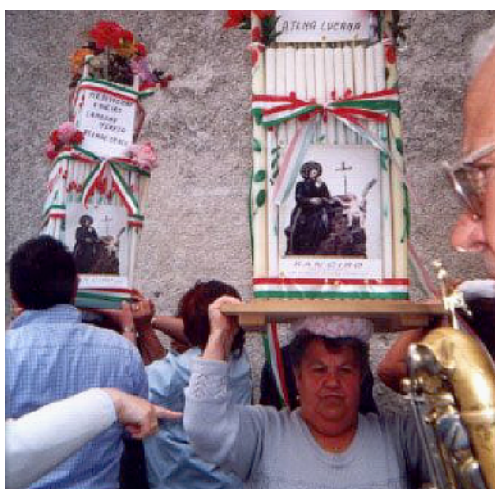
Le Cente indossate dalle donne in processione

della processione, se le collocano sul capo, a volte inframmezzando un fazzoletto ripiegato, e le portano in equilibrio per l'intero percorso. Le Cente aprivano anche i rituali pellegrinaggi al Santuario della Madonna del Monte Gelbison, che ogni comunità raggiungeva una volta all'anno dopo giorni di cammino a piedi. Incerta la loro origine: c'è chi ricollega le Cente al numero delle candele - cento - necessarie per realizzare l'armatura; chi alla funzione votiva, cioè alla funzione di testimoniare una grazia ricevuta. Così come i Gigli di Nola, che i cronisti del tempo li descrivono come ceri adorni di fiori; con il passare degli anni i ceri assunsero dimensioni sempre più grandi e per il loro trasporto fu necessario utilizzare degli appoggi. (r.m.)