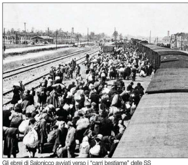
Gli ebrei di Salonico avviati verso i "carrì bestiame" delle SS