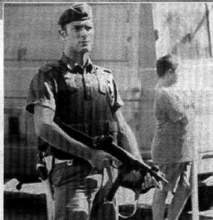
Centocinquanta agenti, tre cani e un elicottero, queste le forze in campo per il blitz nel quartiere degli stracci. Otto, invece, le persone arrestate

Ah! dimenticavo, la citazione è tratta dal dizionario d'italiano della Treccani.