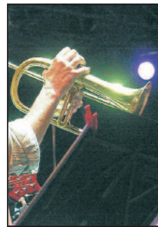
Musica Appuntamento con il jazz di autore

che collabora con diversi musicisti come Session-Man. Tutti accomunati dalla passione per il Jazz che li ha portati a calcare numerosi e prestigiosi palcoscenici dello scenario Jazz italiano.