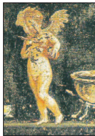
Per gli innamorati Un corso per modellare «Cupido»

Modellato. In occasione del prossimo San Valentino è stato organizzato per domenica pomeriggio un «corso di modellato Ooak» presso il negozio «Brico Tutto» di Caserta. Tutti i partecipanti potranno realizzare, con una tecnica speciale, alcuni personaggi simbolo dell'amore, tra i quali Cupido. Per info basta chiamare al numero 0823353288 o passando per il negozio in via Colombo. Caserta, Brico Tutto Srl, domenica alle 16